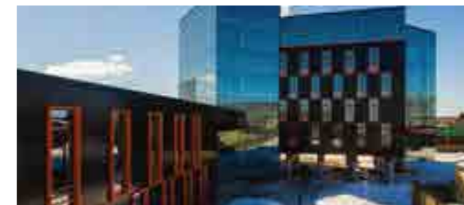
Производственный корпус «УфимКабель», площадь 34 тыс. м 2 , г. Уфа