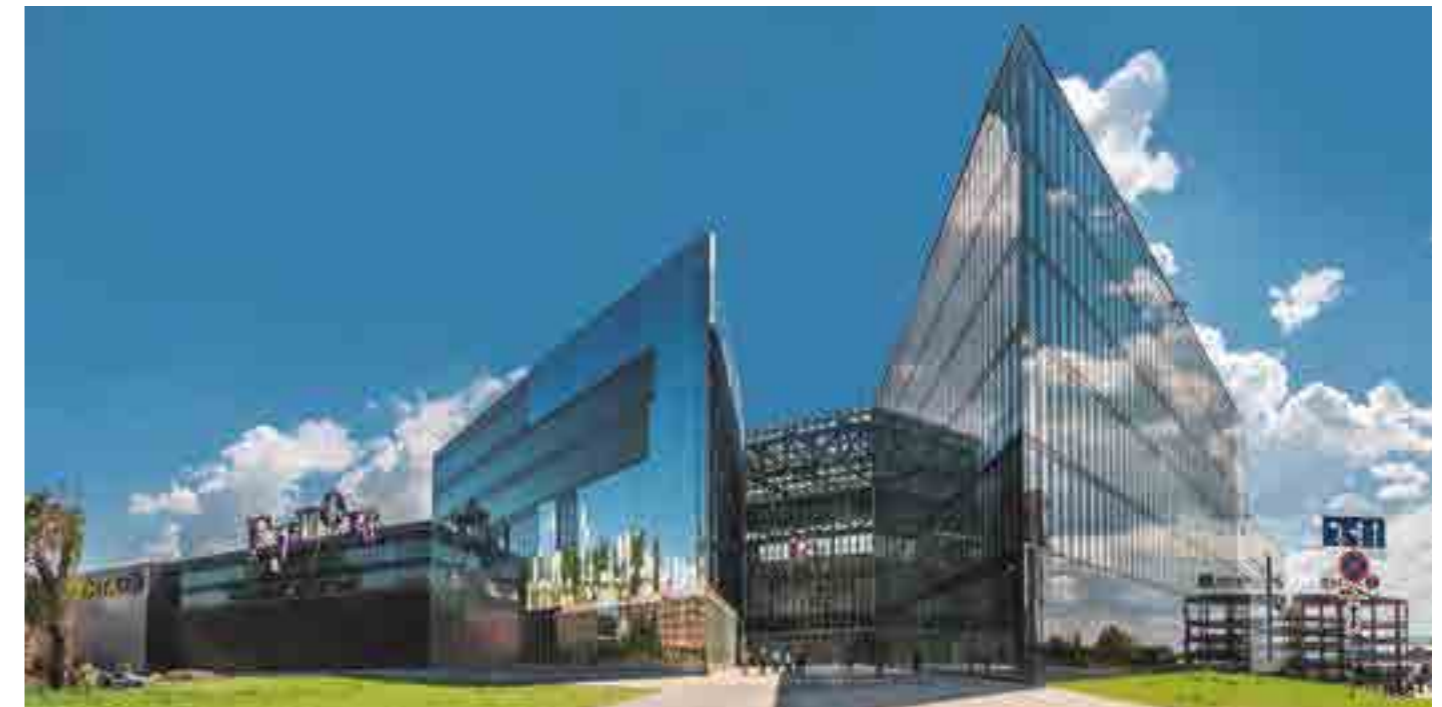
ТРЦ «Гудок», площадь 495 тыс. м 2 , Самарская обл.