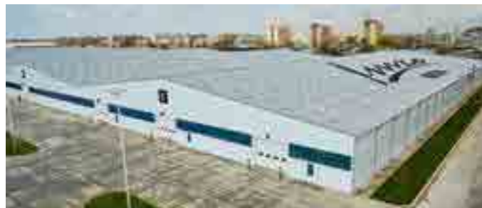
Фабрика оконных конструкций, площадь 76 тыс. м 2 , Узбекистан