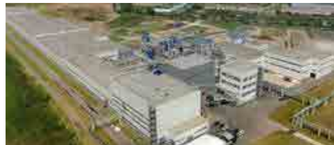
Завод по переработке древесины, площадь 39 тыс. м 2 , Владимирская обл.