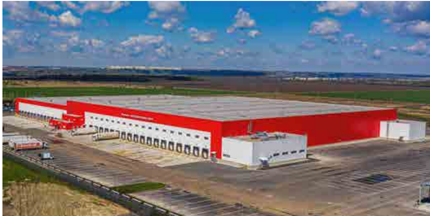
Распределительный центр «Курский», площадь 45 тыс. м 2 , Курская обл.