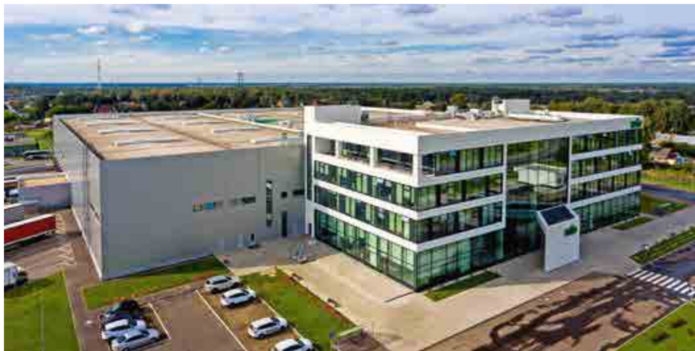
Производственно-складской корпус, площадь 17 500 м 2 , Московская обл.