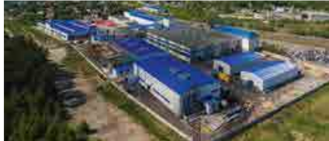
Завод по производству трубопроводов, площадь 10 тыс. м 2 , Курская обл.