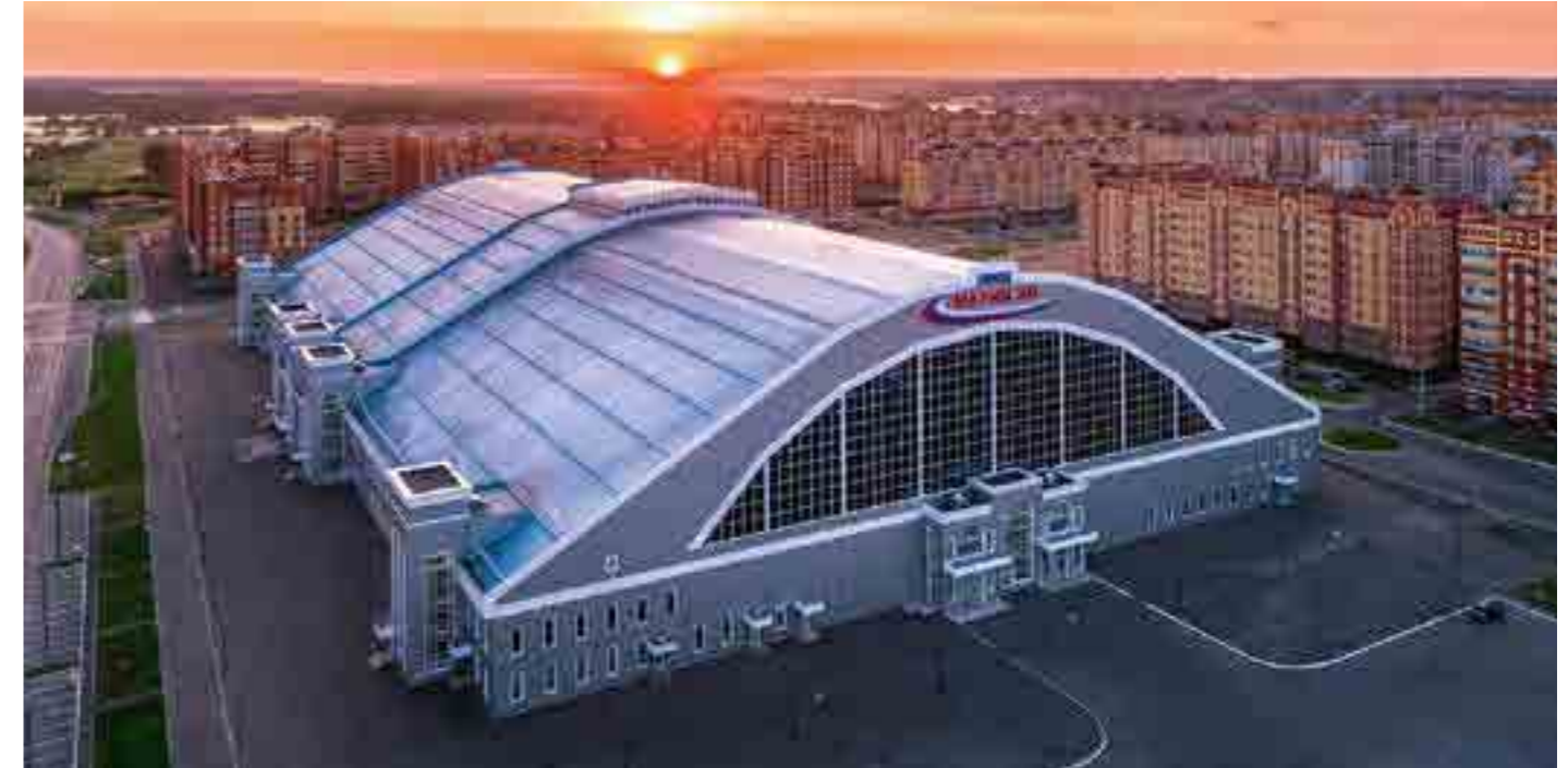
Легкоатлетический манеж, площадь 25 тыс. м 2 , г. Йошкар-Ола