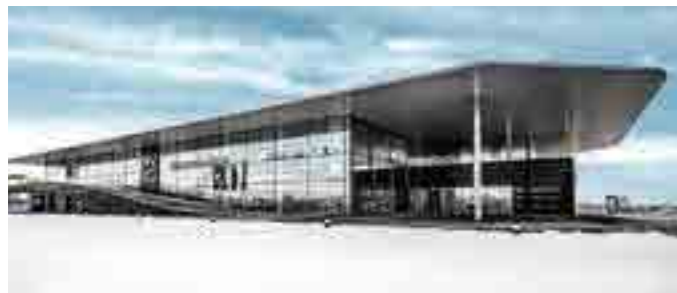
Многофункциональный автоцентр, площадь 6 тыс. м 2 , Казахстан