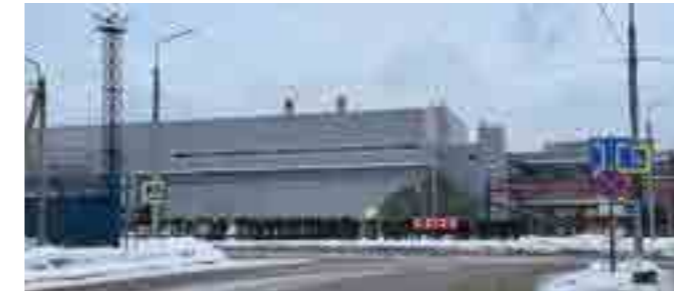
Стан 170 ЧерМК, площадь 15 тыс. м 2 , Вологодская обл.