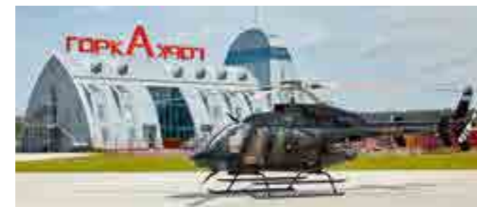
Вертодром «Горка», площадь 2600 м 2 , Московская обл.