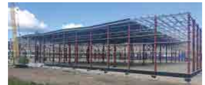
Корпус цеха сборки и логистики, площадь 52 тыс. м 2 , г. Калининград