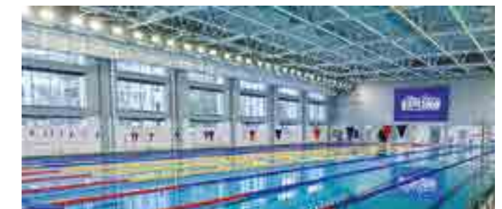
Дворец спорта «Центральный», площадь 42 тыс. м 2