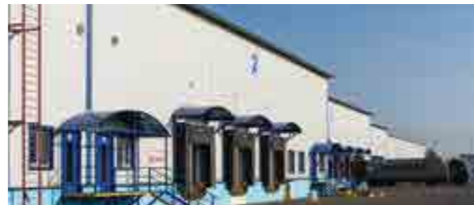
Завод по сборке электроники, площадь 42 тыс. м 2 , г. Щелково