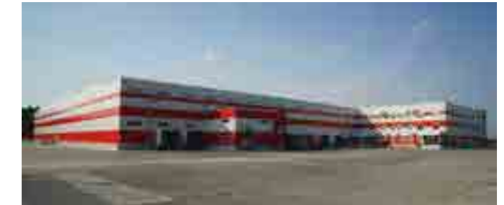
Распределительный центр «Магнит», площадь 19 700 м 2 , Смоленская обл.