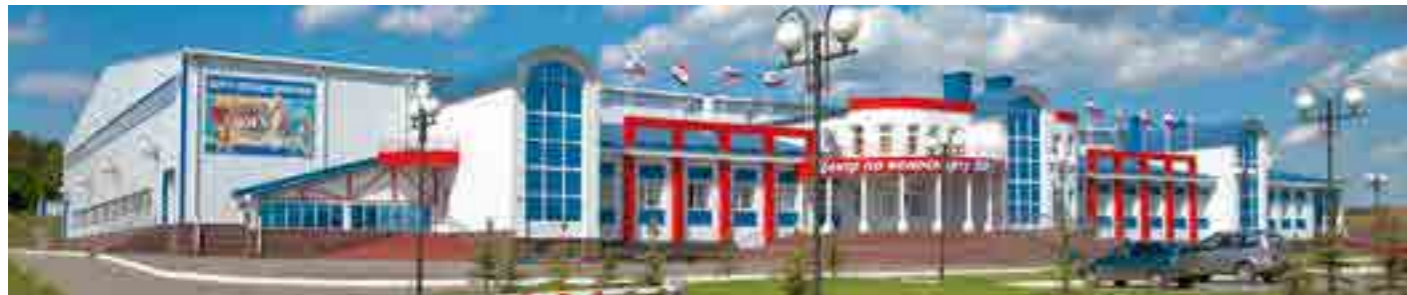
Крытый велодром «ВМХ», площадь 7 тыс. м 2 , г. Саранск