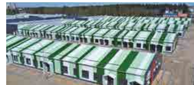
Инфекционный госпиталь, площадь 27 тыс. м 2 , г. Иваново