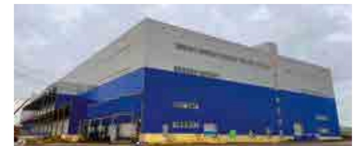
Производственный комплекс, площадь 20 тыс. м 2 , г. Обнинск