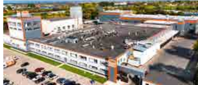
Комплекс по хлебопечению, площадь 10 500 м 2 , Самарская обл.