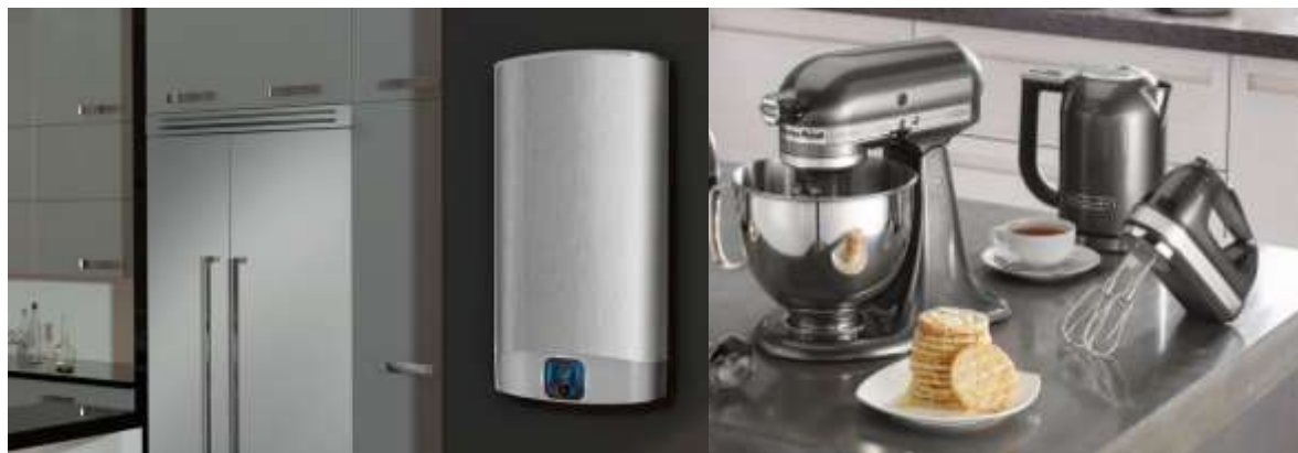
Производители бытовой техники