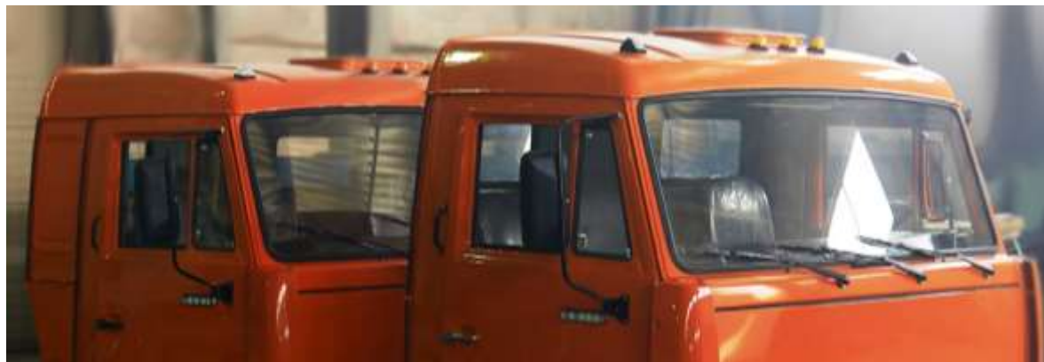
Предприятия автомобильного сектора