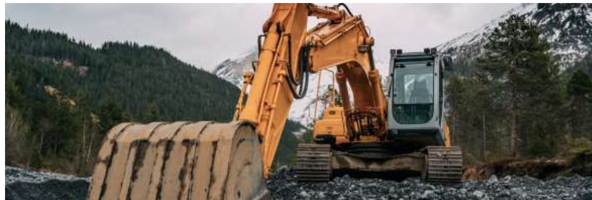
Предприятия тяжелого машиностроения