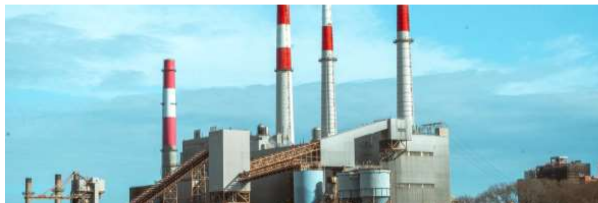
Предприятия нефтегазового сектора